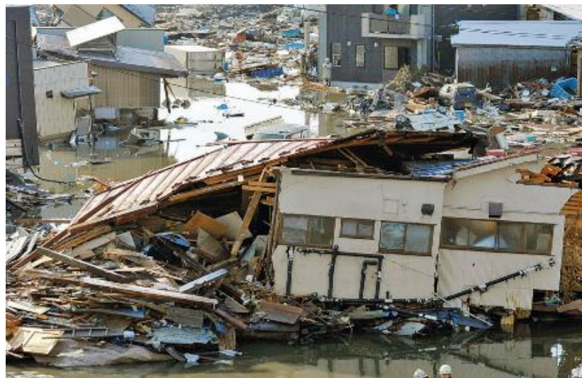
平成23年3月11日 東日本大震災