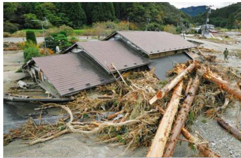
令和元年10月 台風19号