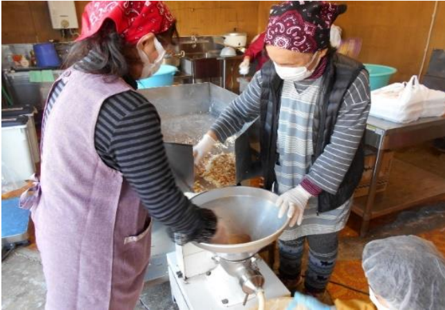
◆味噌造り◆ (女性部 多古支部)

総合農協として組合員の皆様に、指導事業部門による担い手支援等とともに信用事業部門による融資をはじめとする金融面からの支援を展開しております。また、生活・文化活動においては、女性部を核としたサークル活動を展開し、生活とくらしの両面から地域社会に根差した組織として利用者のネットワーク化に取り組んでおります。