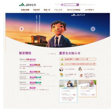
JAかとりホームページ