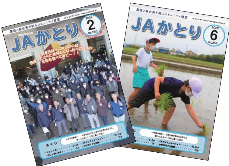
広報誌を毎月発行