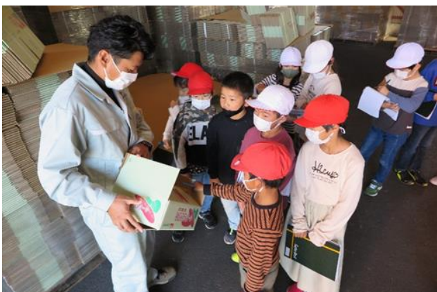
◆管内小学校の社会科見学◆ (栗源小学校)