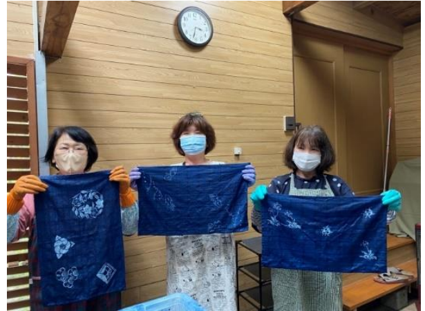
◆ハンドメイド教室 藍染体験◆ (女性部 小見川支部)