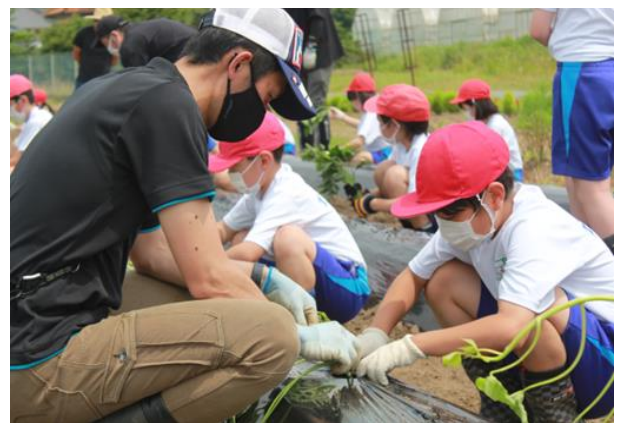
◆芋苗植え体験◆ (大栄みらい学園)