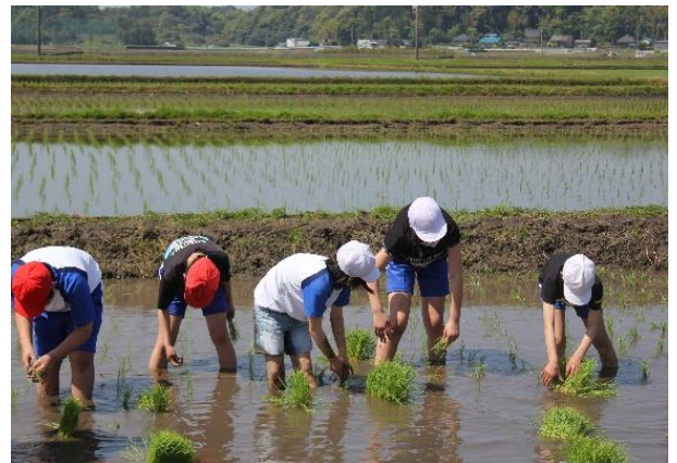
◆田植え体験◆ (小見川北小学校)