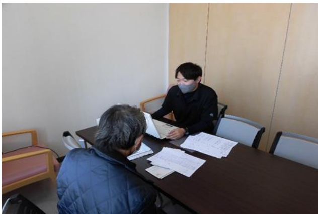
◆確定申告相談・代筆業務◆ (各経済センター)

さらに、食農教育の一つとして、田植えや稲刈り及び芋掘り等の農業体験の場を提供するとともに、地域内各地で行われるふれあい祭等に積極的に参加しております。